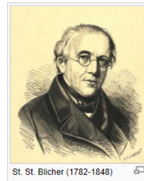
St. St. Blicher (1782-1848)

Steen Steensen Blicher (11.10.1782 - 26.03.1848) er en af de danske kanonforfattere og en af de helt centrale skikkelser i prosagennembruddet. Han er kendt for sine noveller, der er præget af poetisk realisme. Han har et omfattende forfatterskab, hvilket skyldes, at han var en af de eneste forfattere i hans tid, der skrev for at leve. Blichers noveller har den tragiske begivenhed i centrum og et persongalleri bestående af borgere og småkårsfolk i Jylland. Blicher er ikke kendt for selve indholdet i sine historier, men mere for måden han skriver på og brugen af fortæller og miljø. Vi har derfor ikke valgt at beskæftige os med Blicher på baggrund af den periode han skrev i, men mere på baggrund af hans revolutionerende skrivestil. Ud fra ovenstående mener vi, at Blicher er velegnet at bruge til litteraturhistorisk læsning i folkeskolen, idet man gennem hans tekster f.eks. kan sætte fokus på en -isme, en genre, en særlig brug af fortælleren eller bare forfatterskabet i sin helhed.